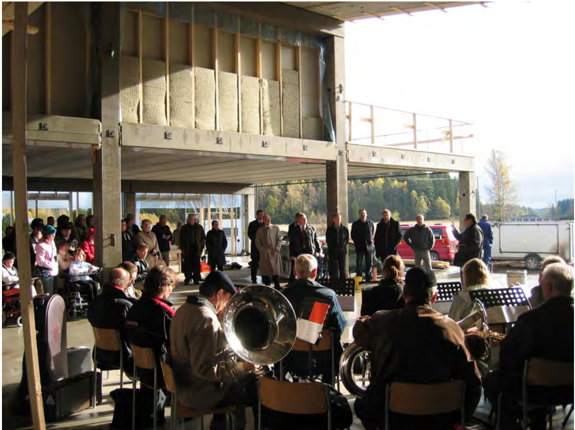
Uuden monitoimikeskuksen peruskiven muuraustilaisuus