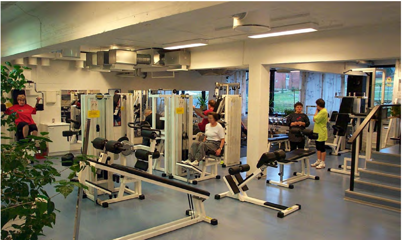
Kaarinan uimahallilla on korkeatasoinen kuntosali. Kuntosalin ohjatut jumput ovat hyvin suosittuja.

Yhteistyön jatkaminen eri toimialojen kesken päiväkotien ja koulupihojen kehittämässä liikunta-aktiivisemmiksi. Yhteistyötä uuden Omaishoidon tukikeskuksen kuntosalin välineistön ja liikuntasisällön toteuttamisessa jatketaan. Tuetaan päiväkotien ja koulujen liikunnan aktivointiin tähtäävien liikuntavälineiden hankintaa resurssien puitteissa.