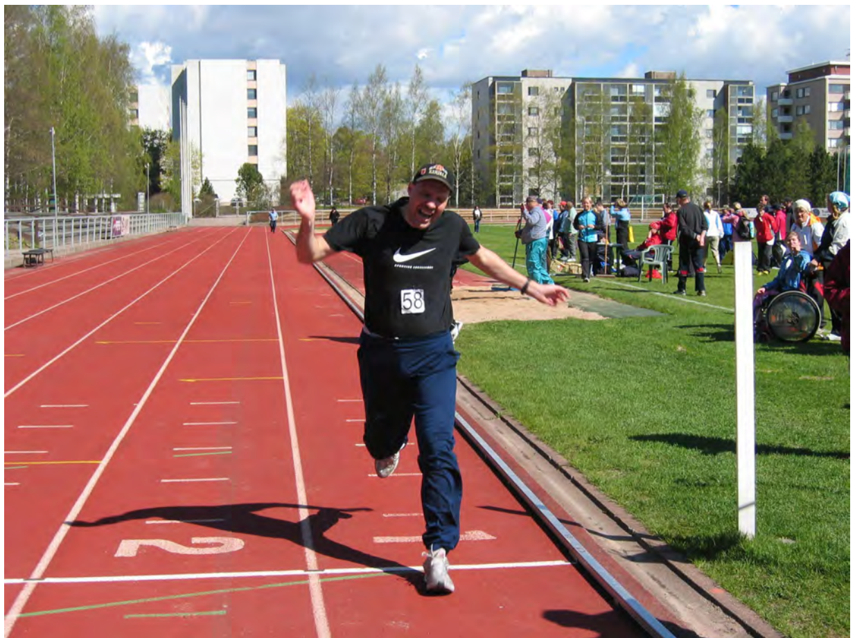
Torpan toimintakeskus järjestää virikkeellistä toimintaa kuntalaisille.