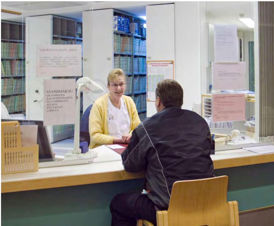
Terveystakeskuksessa saa ystävällistä palvelua.