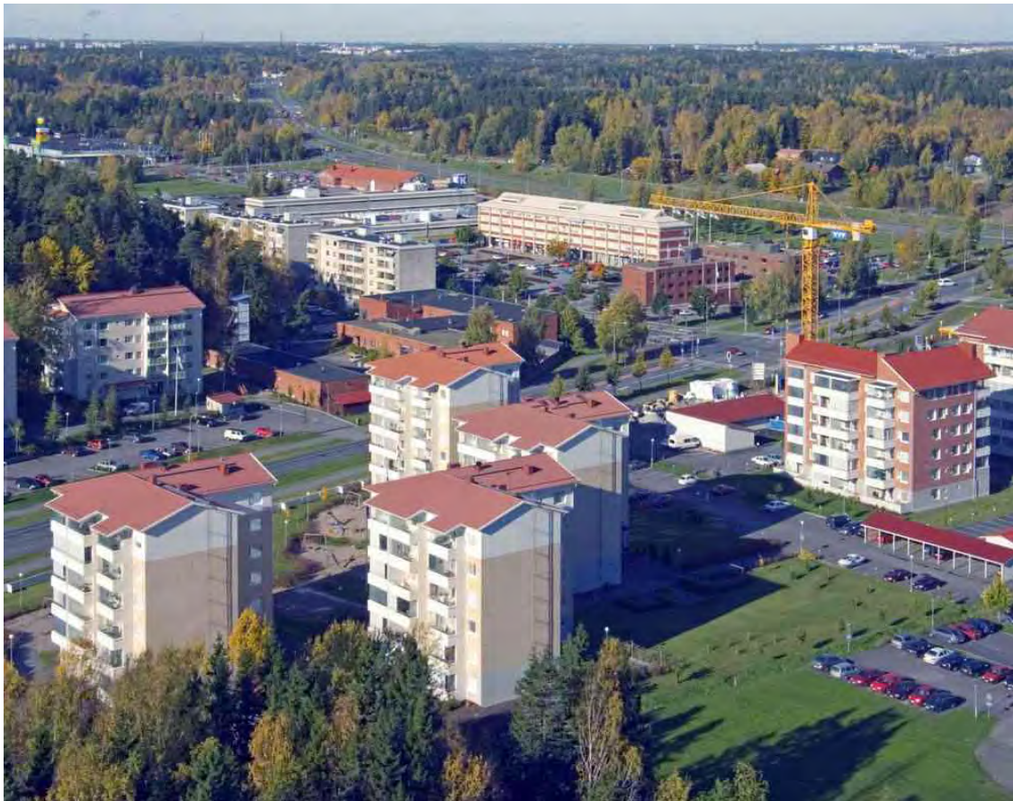
Kaarinan keskustaa kehitetään ja rakennetaan.

Kaavoitus vaikuttaa ympäristön muodostumiseen yleiskaavoituksen ja asemakaavoituksen sekä poikkeuslupien ja suunnittelutarveharkintojen kautta. Kaavoitus osallistuu myös rakennuslupa-valmisteluun ja rakentajien neuvontaan. Kaavoituskohteet perustuvat maankäytön yleisohjelmaan. Toiminnan painopiste on Uudenmaantien varren olemassa olevaa rakennetta täydentävien alueiden suunnittelussa. Nämä ovat keskusta, Pohjois-Keskusta, Herrasniitty, Voivalan ranta, Piispanristi ja Pohjanpelto. Kaikilla alueilla on asemakaavoitus käynnissä tai käynnistymässä. Tavoitteena on saada käynnistettyä myös torin ja Oskarinaukion alueen liikerakentamisen asemakaavoitus. Kaarinan läntisen ohikulkutien yva -menettelyn valmistumisen ajankohta vaikuttaa Lemunniemen osayleiskaavan hyväksymiseen ja Kuusiston osayleiskaavan uudistamisen aloittamiseen. Lemunniemen osayleiskaava voitaneen hyväksyä kaupunginvaltuustossa viimeistään keväällä 08. Yli-Lemun asemakaavallista aatekilpailua ryhdytään järjestämään hyväksymisen jälkeen. Kilpailun merkittävin kustannuserä on palkinnot vuonna 2009, noin 100.000 € Kuusiston osayleiskaavan uudistaminen voitaneen käynnistää vuoden vaihteessa 08/09. Littoisten ja moottoritien varren osayleiskaavojen muutos on käynnissä koko vuoden ajan. Krossin alueella on käynnissä asemakaavatöitä. Niissä tutkitaan muun muassa päivittäistavarakaupan rakentamismahdollisuuksia alueella.