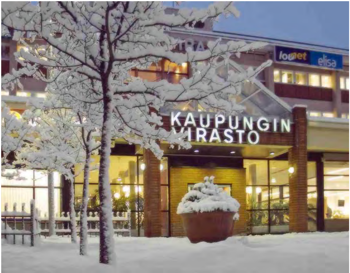
Kaupungin keskushallinto sijaitsee Lautakunnankadulla keskustassa.

Tietoteknisten sovelluksien vuosien mittaan lisääntyessä, tietohallintoyksikkö aloitti syksyllä 2006 laajan, toimialojen käytössä olevien sovelluksien ja tietoteknisten palveluiden kriittisyystarkastelun yhdessä toimialojen kanssa. Tarkastelu vahvisti tietohallinnon käsityksen siitä, että nykyiset tietotekniset tuotantotilat eivät vastaa niitä vaatimuksia, mitkä toimialat asettavat sovelluksiensa toimintavarmuudelle ja vikatilanteista toipumiselle. Vuoden 2007 loppuun mennessä valmistuu suunnitelma tietoteknisten tuotantopalveluiden kehittämisestä siten, että toimialojen vaatimukseen voitaisiin paremmin vastata. Vaikka suunnitelma on vielä osittain kesken, niin nyt jo tiedetään, että vuoden 2008 aikana omia tietoteknisiä tuotantotiloja on kohennettava ja käyttöön on otettava uusi palvelinlaite- ja tallennusjärjestelmäarkkitehtuuri.