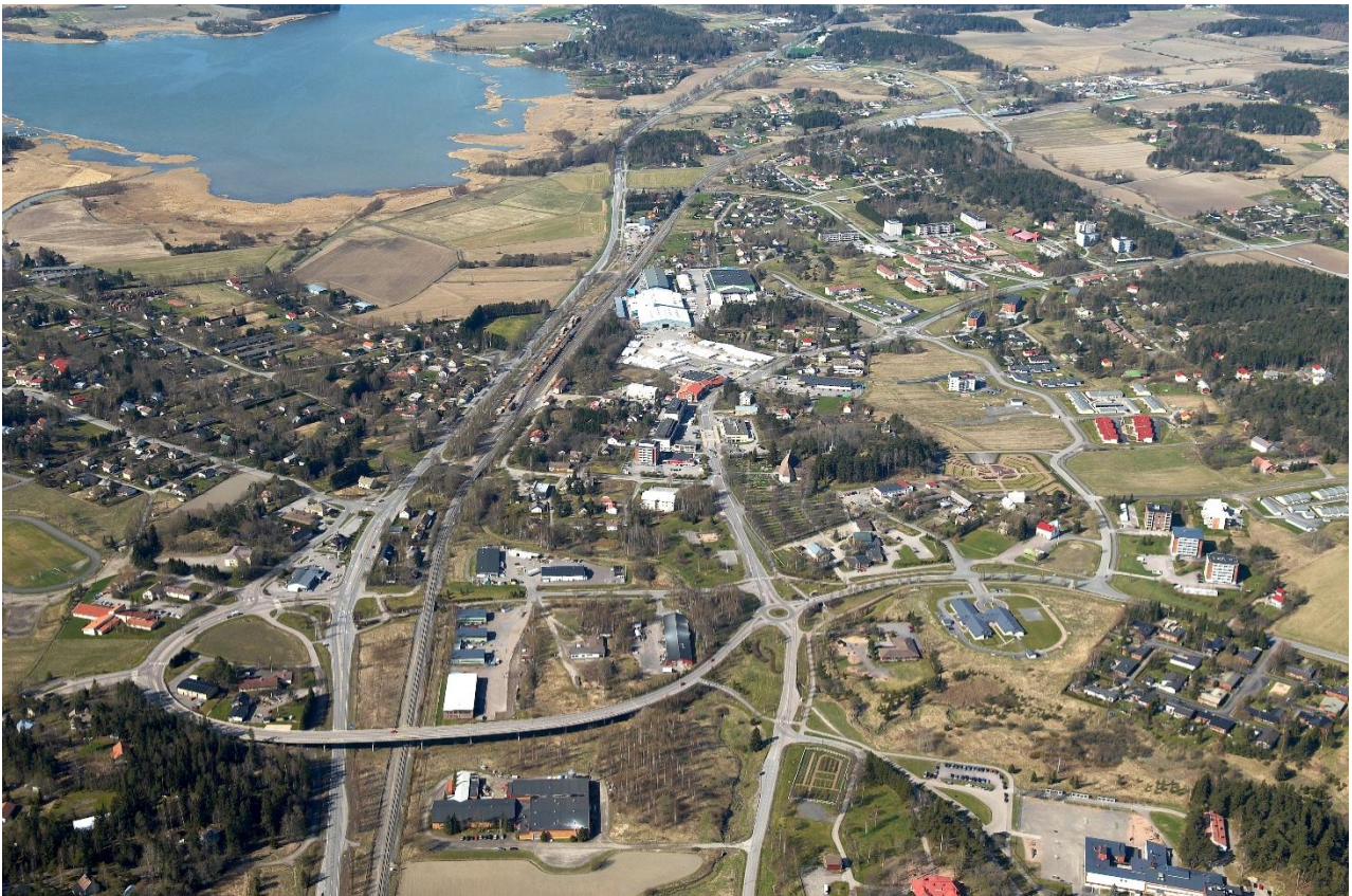
Piikkiön lahden takana siintää Kuusiston saaren pohjoiskulma ja lahden edessä on Piikkiön keskusta.