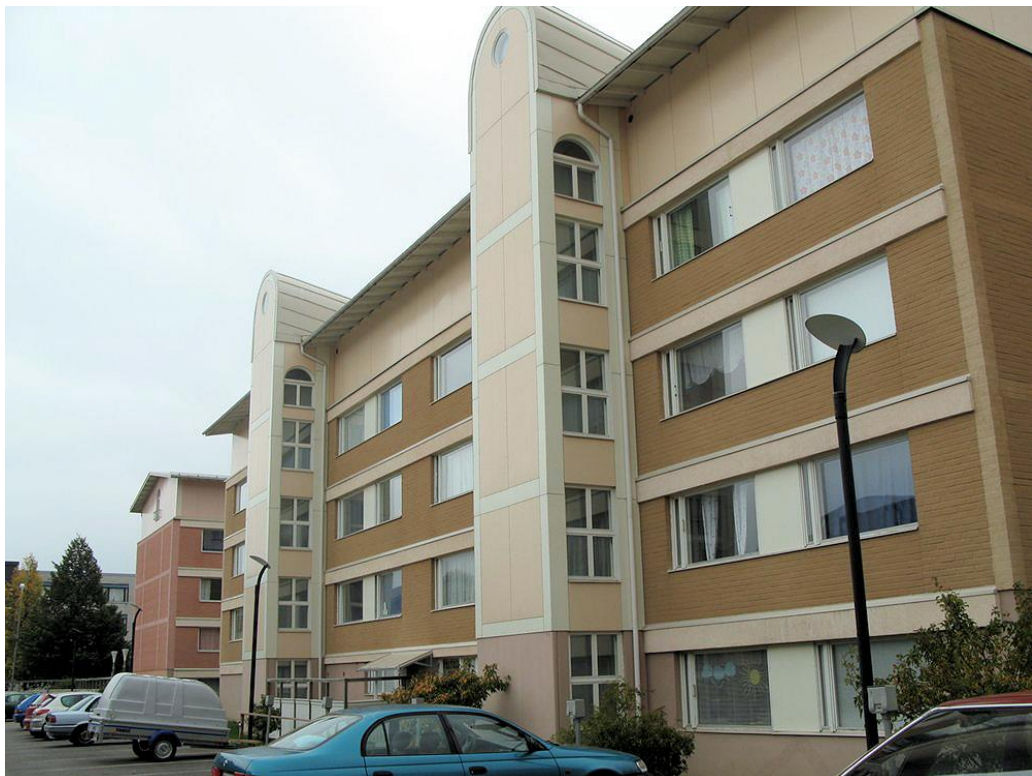
Vuokratalo Pehtorinkatu 2:ssa.