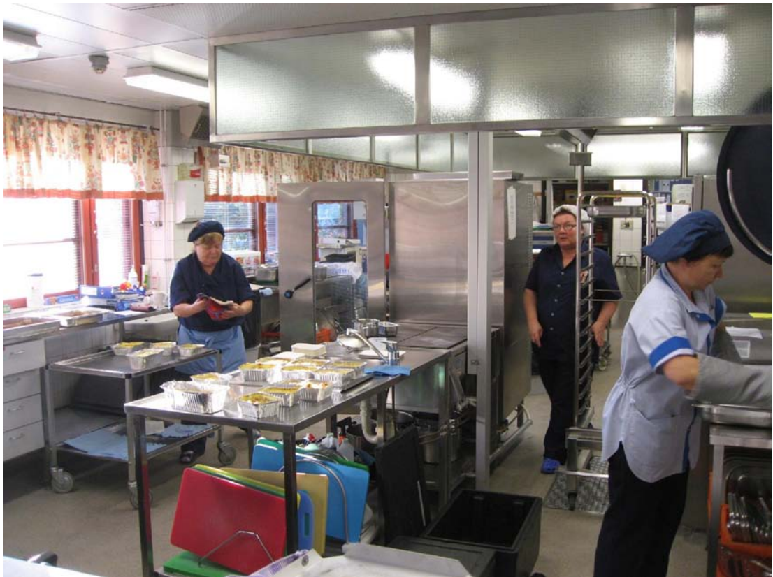
Hovirinnan koulun keittiö

Vuoden aikana tavoitteenamme on tasoittaa ja vakiinnuttaa tilanne uusien palvelukeittiöiden osalta. Tämän lisäksi tarkastelemme, pystymmekö tehostamaan valmistuskeittiötämme nykyisellä rakenteella vielä lisää. Suunnitteilla on myös virastotalojen ja terveyskeskuksen henkilöstöruokailun ja kokoustarjoilujen ulkoistaminen.