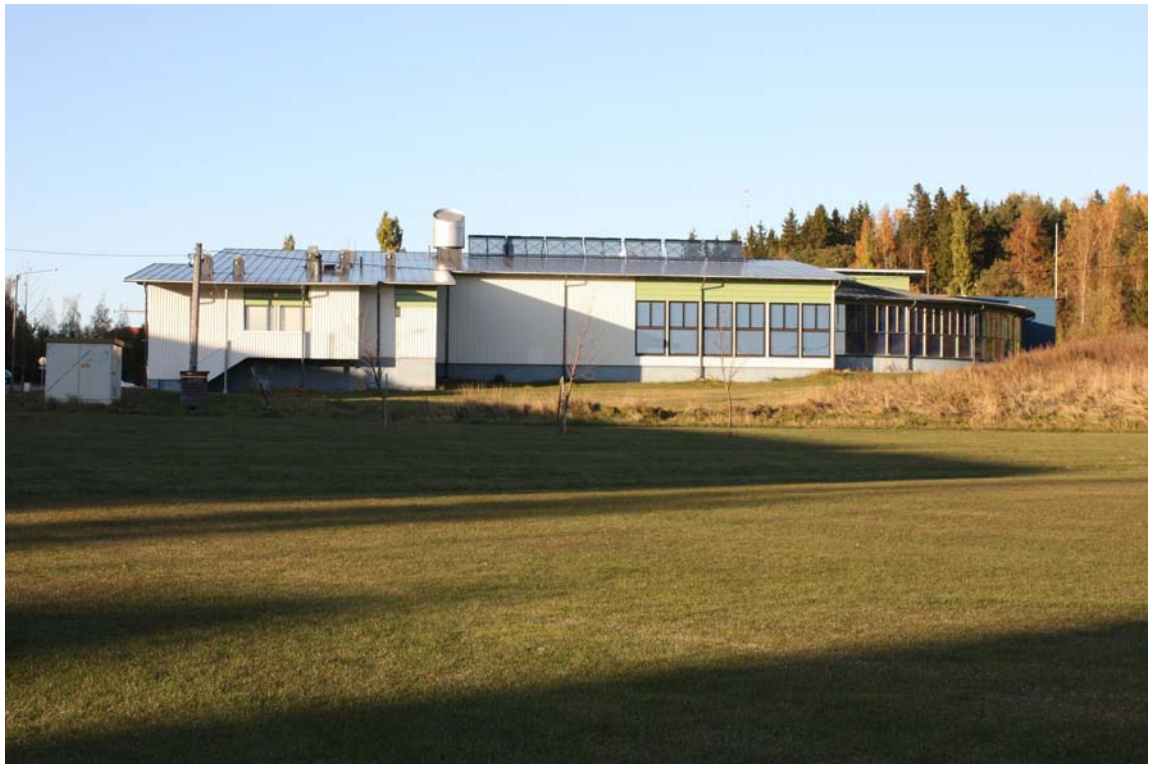
Kaarinan uimahallin katolla näkyy seitsemän aurinkolämpökeräintä, jotka lämmittävät aurinkoisella päivällä kaiken käyttöveden ja myös osan allasvedestä talvellakin.

Energiankäytön tehostamissuunnitelman mukaisia käytännön toimenpiteitä jatketaan. Piikkiön ja Terveyskeskuksen piirustusten saattaminen puuttuvilta osin sähköiseen muotoon jatkuu. Tiedot tallennetaan FacilityInfo-ohjelmaan.