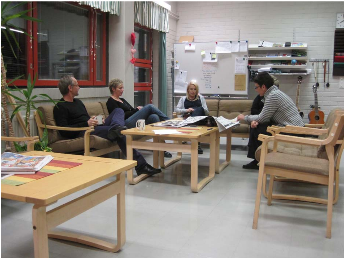
Hovirinnan koulun opettajien huone

Lukiolla tavoitteena on vetovoiman säilyttäminen. Sitä mitataan ylioppilaskirjoituksissa menestymisellä suhteessa muihin päivälukioihin ja aikuislukioihin. Opiskelijoiden syrjäytymistä ehkäistään opinto-ohjauksen avulla. Samalla seurataan opiskelunsa keskeyttäneiden opiskelijoiden määrää ja heidän sijoittumistaan.